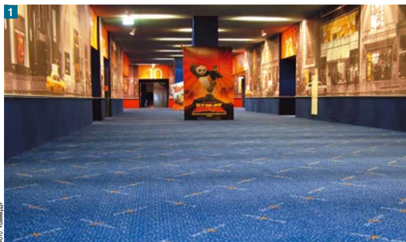
1 Стены Kinostar New York–New York украшены панорамой улиц Нью-Йорка, но под ногами посетителей не асфальт, а ковровое покрытие.